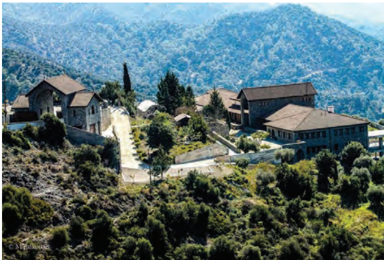
Ίερά Μονή Παναγίας Άμμορούς

Ήρακλειδίου, μέ ήγουμένη τή γερόντισσα Μαριάμ εις διαδοχή της μακαριστής γερόντισσας Μαριάς.