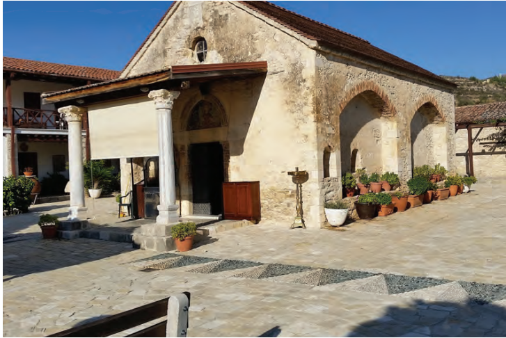
Ίερά Μονή Αρχαγγέλου Μιχαήλ, Μονάγρι