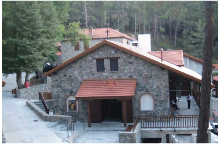
Ἱερά Μονὴ Τιμίου Προδρόμου Μέσα Ποταμοῦ

Ἡ ὑπαρξὴ τῆς Μονῆς Συμβούλου Χριστοῦ, καὶ ὡς ἐκ τούτου καὶ ἡ ἀκριβὴς τοποθεσία