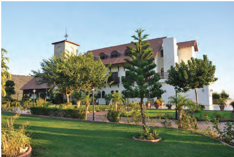
Ἱερά Μονὴ Συμβούλου Χριστοῦ