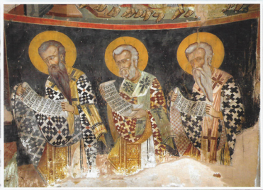
Ἐκδόσεις Ίεράς Μητροπόλεως Λεμεσού 2016