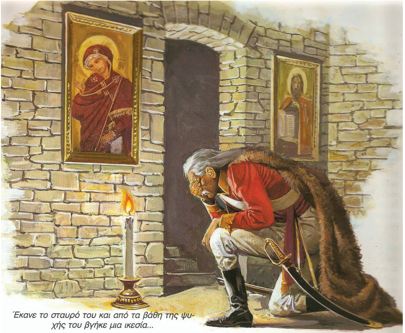
Έκανε το σταυρό του και από τα βάθη της ψυχής του βγήκε μια ικεσία...

διδασκόμενος. Όταν ζήτησε από τον λόγιο εκείνο Γυμνασιάρχη να μιλήσει στους μαθητές, ο Γεώργιος Γεννάδιος όρισε ως χώρο όμιλίας την Πνύκα την έπομένη στίς δέκα ή ώρα τό πρωί.