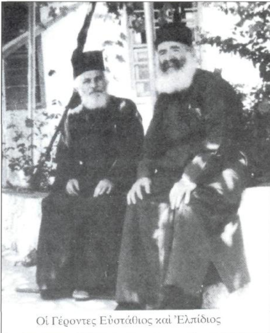
Οί Γέροντες Ευστάθιος και Έλπίδιος

"Όπως γνωρίζουμε από τους βίους των αγίων, τέτοια γεγονότα εισόδου στον ναό, χωρίς να είναι ανοικτοί οι ναοί, συναντούμε αρκετά. Πολλοί δέ αγιοί προσπύχοντο έξω από τις εκκλησίες κι άνοιγαν οι εκκλησίες κι έμπαιναν μέσα. Στη Νέα Σκήπη ο π. Ευστάθιος έκτελούσε και καθήκοντα γραμματέως στη σύναξη. Και στα τέσσερα χρόνια, που ήταν αυτός γραμματέας στη Νέα Σκήπη, ποτέ δεν σημειώθηκε οποιαδήποτε φιλονικία, όταν παρουσιάζονταν διάφορα προ-