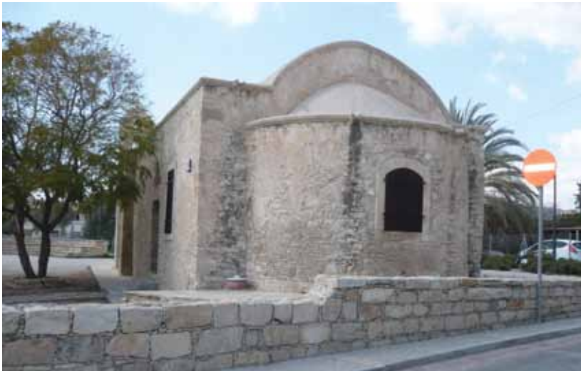
Παρεκκλήσιο Αγίου Γεωργίου, Κάτω Πολεμίδια.

Στή συνέχεια σκοτώνει τόν δράκοντα, πού δέν άφηγε τό νερό νά πάει στην πόλη, και τόν μεταφέρει άλυσοδεμένο στο παλάτι του βασιλιά, για νά τόν δούν όλοι, νά χαρούν και νά δοξάσουν τόν Θεό. Στην πρόταση του βασιλιά νά του δώσει τό βα-