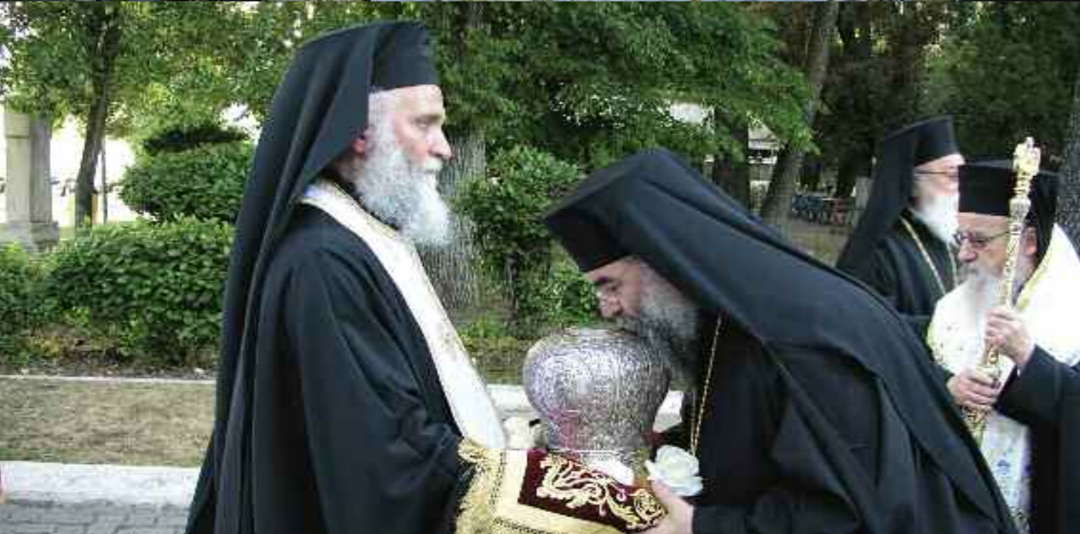
Από τις εορταστικές εκδηλώσεις προς τιμή των Αγίων Νεομαρτύρων Παύλου και Δημητρίου των έν Τριπόλει, Πολιούχων τής Ίεράς Μητροπόλεως Μαντινείας και Κυνουρίας, Τρίπολη 22 Μαΐου 2008